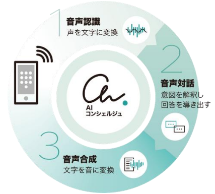
『AI コンシェルジュ®』サービスイメージ

『AI コンシェルジュ®』詳細はこちら： https://www.tactinc.jp/ai